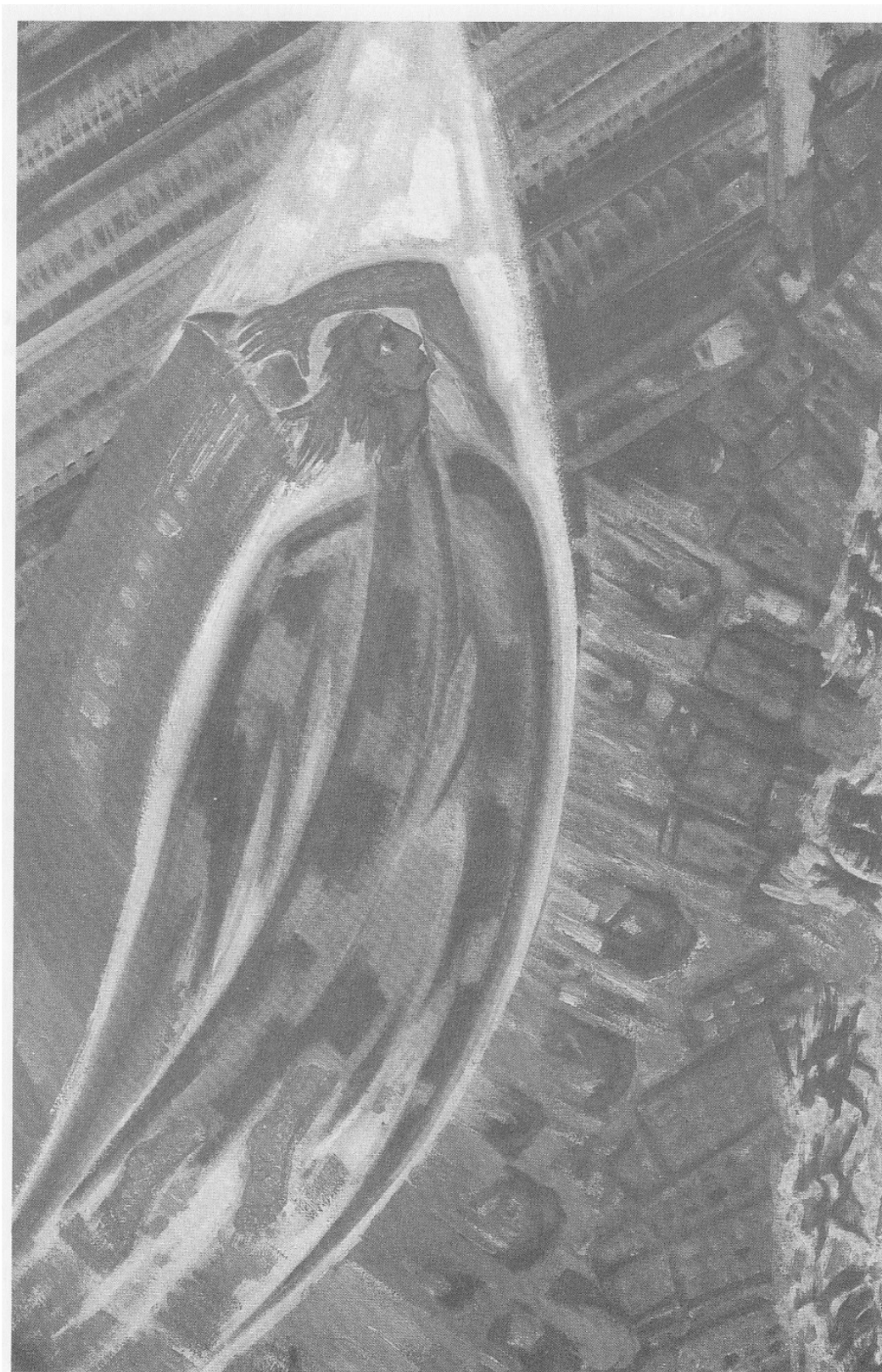
Isten lerombolja (elpusztítja) a bukott Egyházakat (A Nagy Parázna felbukkanása; Jelenések könyve 17).