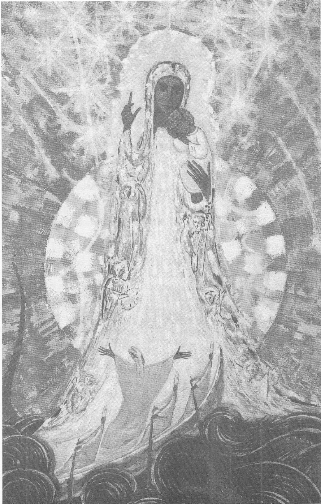
A Sárkány harcban áll a Nő Gyermekevel (Jelenések könyve 12,17)